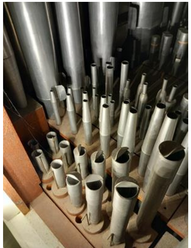
Het inwendige van het orgel voor de schoonmaak, totaal zijn er ca 800 pijpen!