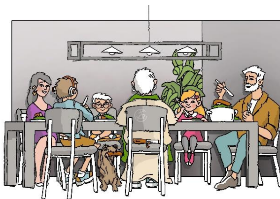
DOMINEE, EET JE MEE?